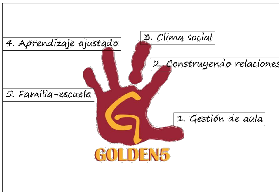
Ilustración 2. Áreas Golden

El programa Golden5 se estructura en cinco áreas, llamadas áreas Golden y que consideramos necesarias y relevantes para que el profesorado pueda cambiar su aula, y ayudar al alumnado que más lo necesite (ver cuadro 2).