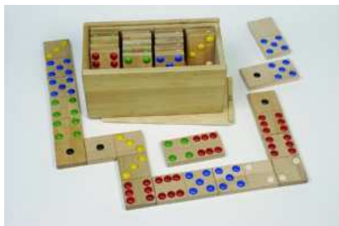
Dominoa: 8 €