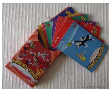
Film bilduma: 75€