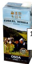
1 litro esne 1 €