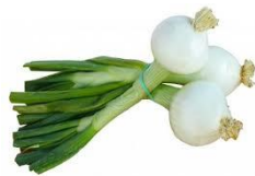
3 tipulina 1 €