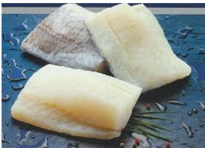
Bakailoa, 400 g-ko paketea 7 €