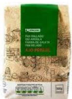
300 g ogi birrinduta 0,99 €