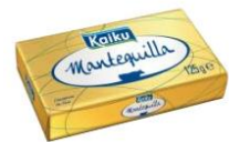
125 g 3 €